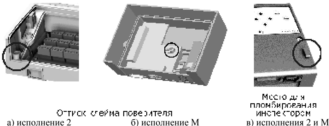
Рисунок 2 - Схема пломбировки тепловычислителя

В целях предотвращения доступа к узлам регулировки и настройки, а также к элементам конструкции предусмотрены места нанесения знака поверки - оттиска клейма поверителя на специальной мастике, расположенной в чашечке винта крепления по рисунку 2.